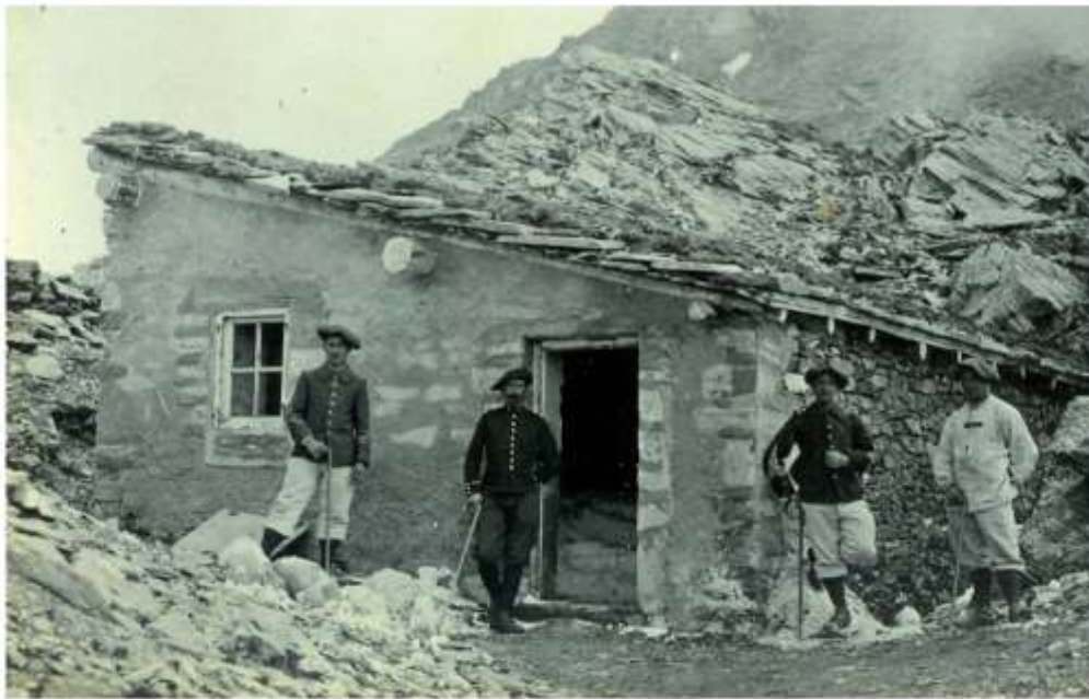
Le baraquement du col des Randouillards au début du XX e siècle.