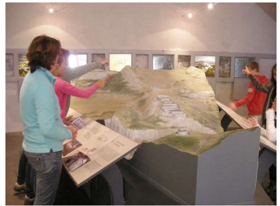
Photos : Musée de l'école de La Minière / Angelots baroque en l'église de Beune / Maquette des Forts de l'Esseillon à la Redoute Marie-Thérèse.