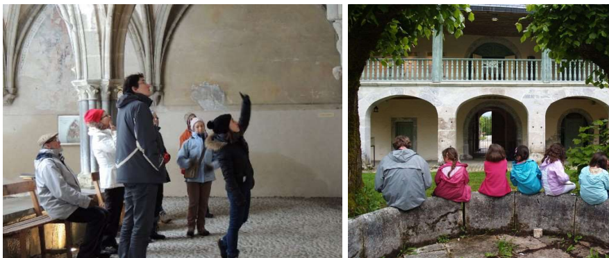
Photos : Abbaye d'Abondance et Chartreuse d'Aillon.

Programme et réservations en ligne : www.les-enfants-du-patrimoine.fr