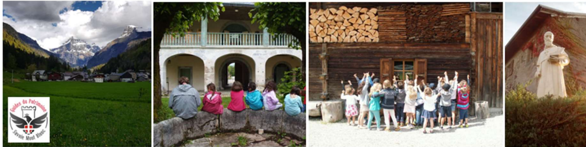
Sixt-Fer-à-Cheval Grand Site / Ateliers pédagogiques à la Chartreuse d'Aillon / Accueil de classes au Grand Bornand / Année Saint-François-de-Sales (depuis le château neuf d'Allinges)... Retrouvez toutes les propositions des #GuidesPSMB sur www.guides-patrimoine-savoie-mont-blanc.fr .

Au croisement de la nature et du travail de l'homme à travers les âges, découvrez le patrimoine savoyard en suivant les visites guidées et ateliers pédagogiques 2022 des Guides du Patrimoine de Savoie Mont-Blanc.